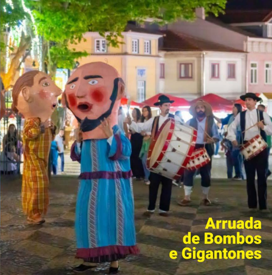
Arruada de Bomberos e Gigantes