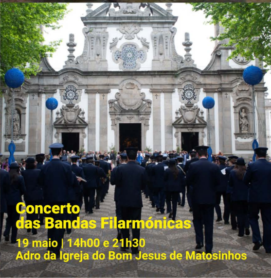
Concerto das Bandas Filarmónicas

19 maio | 14h00 e 21h30 Adro da Igreja do Bom Jesus de Matosinhos